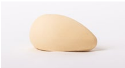
Cremeux peer - boter Crèmeux de poire et beurre