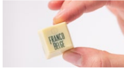
Witte chocolade Chocolat blanc