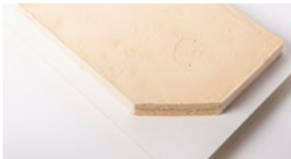
Vanille - chocoladeroomijs Glacé à la vanille et au chocolat