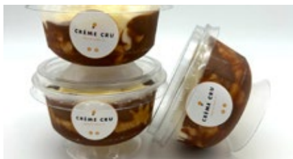
Coupe dame blanche Coupe dame blanche