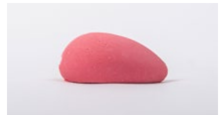
Framboos sorbet Sorbet à la framboise