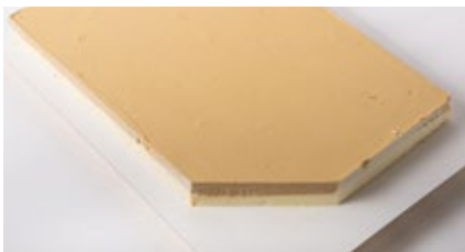
Vanille - mokka roomijs Glacé à la vanille et moka