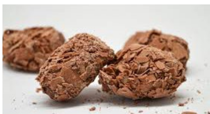
Chocolade truffels Truffes au chocolat