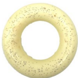
Panna cotta ringen Anneaux de panna cotta