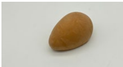
Chocolade mousse Mousse au chocolat