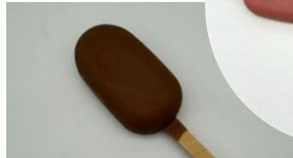
Mini frisco vanille - melk chocolade Mini frisco glace à la vanille au chocolat au lait