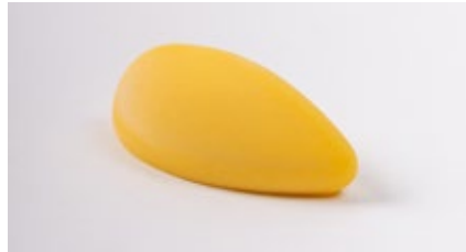
Cremeux exotique Crèmeux exotique