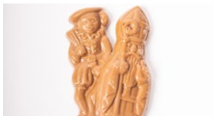
Karakken Sint & Piet Caraques au choc. Saint Nicolas