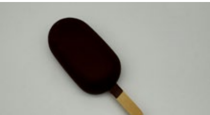
Mini frisco framboosorbet - fon- dant chocolade Mini frisco sorbet framboise au chocolat fondant