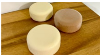
Chocolade mousse Mousse au chocolat