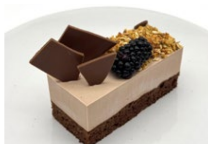
Chocolade / brownie bar Barre au chocolat et brownie