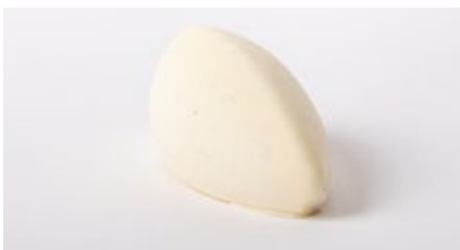
Vanille bourbon roomijs Glace à la vanille bourbon