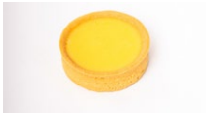
Croute citroen / witte chocolade Croûte citron / choc. blanc