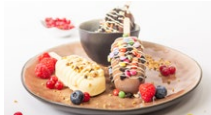
Gepersonaliseerde frisco Frisco personnalisée