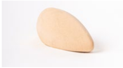
Chocolade mousse Mousse au chocolat