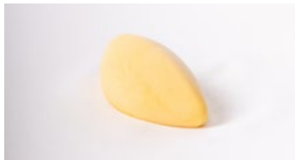
Cremeux citroen Crèmeux de citron