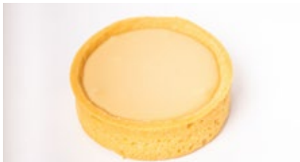
Croute ganache caramel chocolade Croûte ganache Caramel et choc.