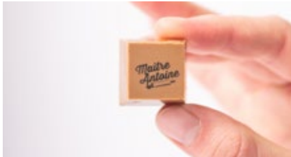
Individueel verpakt Emballage individuelle