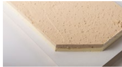
Vanille - praliné met nootjes roomijs Glacé à la vanille et praliné aux noisettes