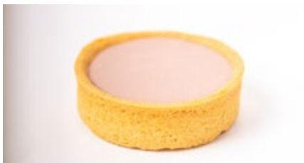
Croute ganache ruby chocolade Croûte ganache choc. ruby