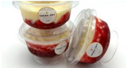
Coupe vanille - framboos Coupe vanille - framboise