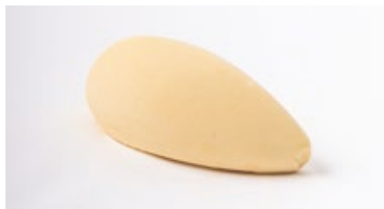
Speculoos roomijs Glace au spéculoos