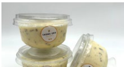
Coupe stracciatella Coupe stracciatella