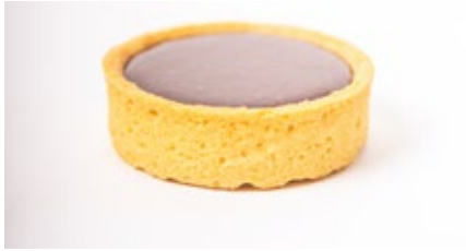
Croute ganache fondant Croûte ganache choc. fondant