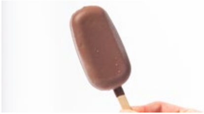
Frisco framboosorbet - fondant chocolade Frisco sorbet de framboise - chocolat