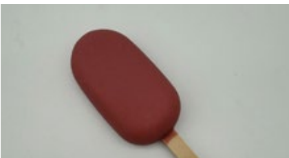
Mini frisco vanille - ruby chocolade Mini frisco vanille et chocolat ruby