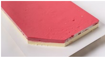
Vanille roomijs - framboos sorbet Glacé à la vanille - sorbet à la framboise