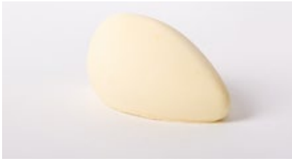
Witte chocolademousse Mousse au chocolat blanc