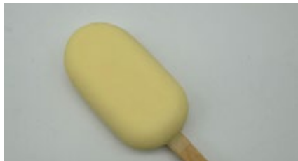
Mini Frisco vanille-citroen omhuld met witte chocolade Frisco vanille - citron au choc. blanc