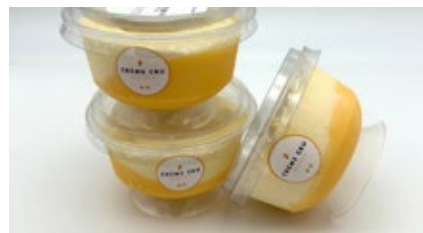
Coupe advocaat Coupe avocat