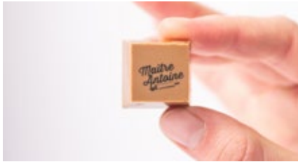
Melkchocolade Chocolat au lait