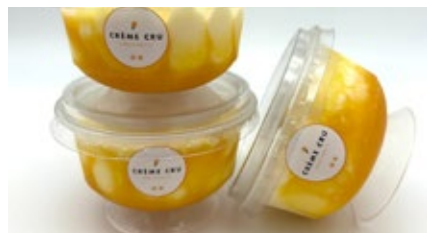
Coupe exotique Coupe exotique