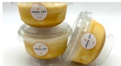
Coupe caramel beurre salé Coupe caramel beurre salé