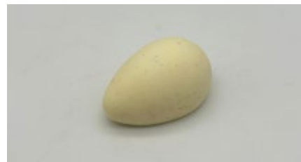
Vanille bourbon roomijs Glace à la vanille bourbon