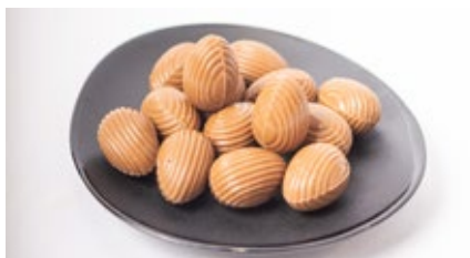
Chocolade paaseieren œufs en chocolat de Pâques