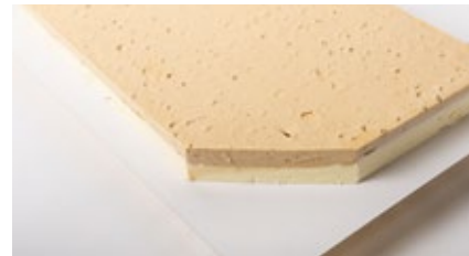
Vanille - speculoos roomijs Glacé à la vanille et spéculoos