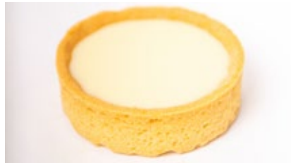
Croute ganache witte chocolade Croûte ganache choc. blanc