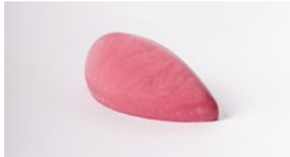
Cremeux framboos Crèmeux de framboise