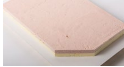
Vanille - aardbei roomijs Glacé à la vanille - fraise