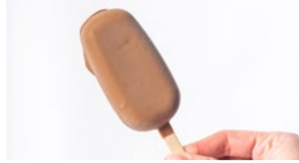
Frisco vanille - melk chocolade Frisco vanille - chocolat au lait