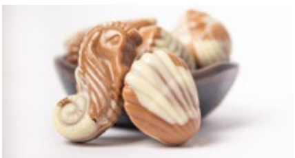
Chocolade zeevruchten fruits de mer au chocolat