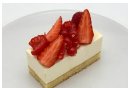
Marscarpone bar Barre au mascarpone