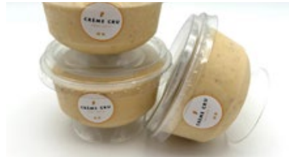
Coupe speculoos Coupe spéculoos